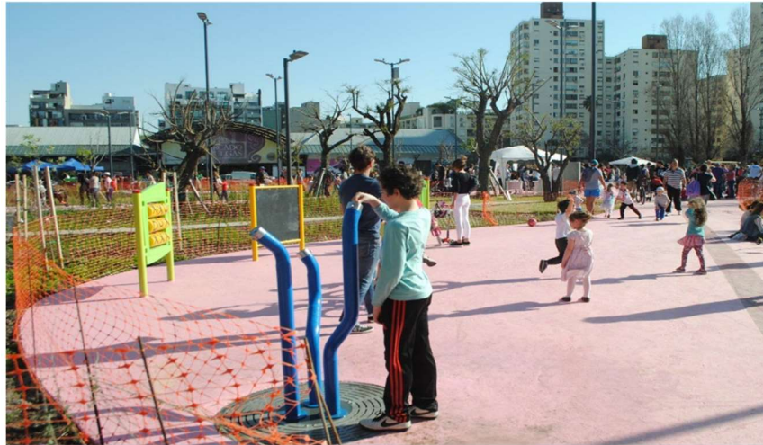
Imagen 11. Hay un chico parado junto a un bebedero y detrás se observan juegos como un ábaco gigante y un pizarrón. Varios niños y niñas están jugando cerca.

En apoyo a la movilidad, el solado de la plaza es de un material liso, una superficie continua y transitable sin desniveles, que no solo favorece a personas usuarias de sillas de ruedas, scooters y andadores sino también a niños con bicicletas, patines y otros rodados y personas mayores. Además, se incorporaron juegos sensoriales ( Imagen 11 ) y se colocaron cuatro planos hápticos que permiten que las personas en situación de discapacidad visual tengan información táctil en relación a lo que se van a encontrar en ese espacio ( Imágenes 12 ).