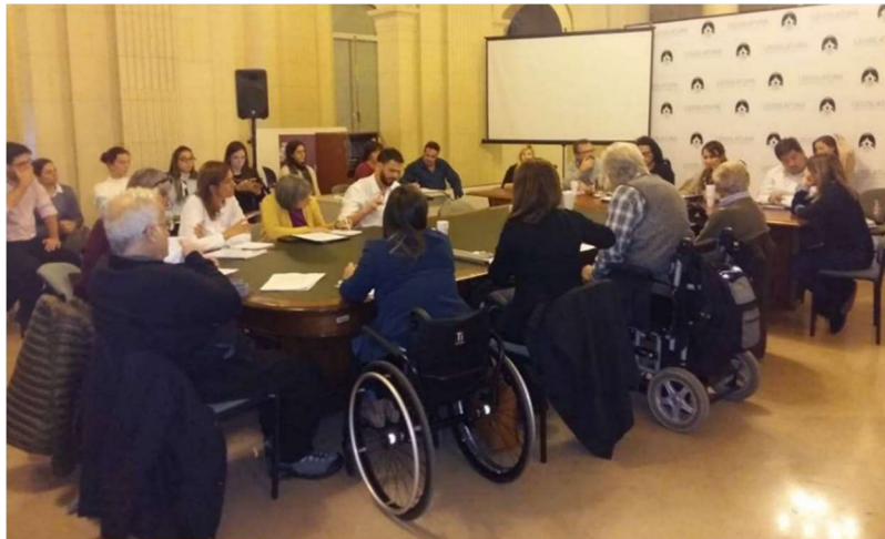
Imagen 1: Debate por el Código de Edificación de la ciudad de Buenos Aires. Una de las jornadas de la Mesa de Accesibilidad en la Comisión de Planeamiento Urbano de la Legislatura porteña, donde se encuentran reunidas las personas recién nombradas, varias de ellas usuarias de silla de ruedas.

Insistimos y logramos la conformación de una Mesa de Accesibilidad en la Comisión de Planeamiento Urbano de la Legislatura de la Ciudad, con representantes del poder Ejecutivo, a la que se incorporaron representantes del Observatorio de las Personas con Discapacidad de CABA, de APEBI (Asociación Espina Bífida), un especialista del Centro de Investigación y Asesoramiento sobre el Hábitat Gerontológico de la Sociedad Central de Arquitectos, y de la Defensoría del Pueblo de la Ciudad ( Imagen 1 ).