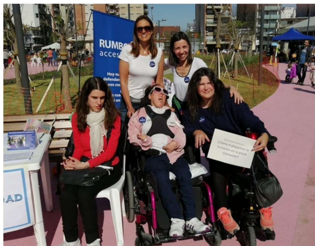
Imagen 10: Integrantes de Rumbos y de REDI (Red por los derechos de las personas con discapacidad) en un stand sobre accesibilidad en la Plaza Clemente.