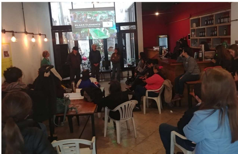
Imagen 8: Plaza Clemente. Uno de los encuentros con numerosos vecinos y vecinas en un local del barrio, sentados mirando una presentación en una pantalla.

Iniciamos entonces un proceso de diseño participativo vecinal ( Imagen 8 ). En los dos meses de reuniones, surgió un programa de diseño basado en tres ejes: plantación de flora nativa, diseño de espacios y equipamientos inclusivos y respeto por la historia e identidad del barrio de Colegiales. Finalmente conseguimos ser convocados por el Ejecutivo de la Ciudad y nuestras ideas fueron confrontadas con la propuesta del GCBA. En una síntesis final, donde se impusieron los 3 ejes surgidos de la participación popular, el GCBA preparó los planos y llamó a licitación para la construcción de la plaza. El 2 de julio del 2019 se inauguró la Plaza Clemente.