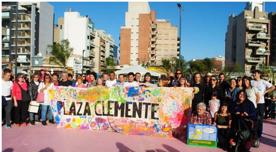
Imagen 9: Un numeroso grupo de vecinas y vecinos con un gran cartel que dice Plaza Clemente rodeado de huellas de manos hechas con pintura de colores. Esta actividad fue convocada por el aniversario de Colegiales y fue la inauguración vecinal de la plaza.

Quienes defendimos esta plaza lo hicimos con sentido de inclusión social. Por eso, entre otras cosas, buscamos que el proyecto a implementarse contemplara accesibilidad: apoyos que requieren las personas en situación de discapacidad para disfrutar de los lugares y realizar actividades. Y el desafío fue lograr la consulta efectiva a personas en situación de discapacidad por parte del Ejecutivo en las distintas etapas de la obra. Sólo se logró en parte. Por una gran insistencia nuestra, hubo una instancia de visita a obras con integrantes de la comisión de discapacidad de la Legislatura, pero las observaciones no fueron tomadas con la profundidad necesaria ( Imágenes 9 y 10 ).