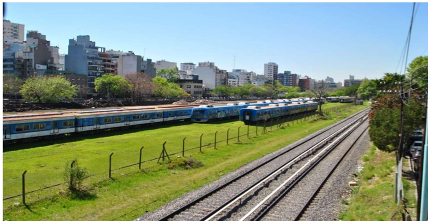
Imagen 13: Vista general del Playón Ferroviario de Colegiales, parte de las vías, el césped, unos vagones y el fondo con edificios y árboles.

Estos últimos años venimos participando en la defensa del Playón Ferroviario de Colegiales, denunciando la construcción de torres en una parte del predio que debería ser 100% verde ( Imágenes 13 y 14 ). Promovimos la participación de personas en situación de discapacidad y sus organizaciones en el proceso de diseño del parque, que actualmente se encuentra en construcción e hicimos foco en la incorporación de condiciones de accesibilidad dentro del mismo. A pesar de nuestra insistencia y de nuestras ganas de participar, no resulta fluida la comunicación con el Ejecutivo de la ciudad.