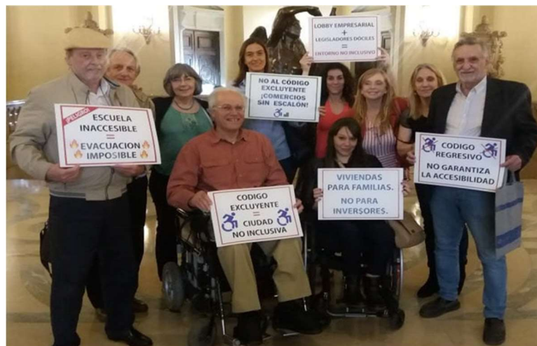
Imagen 4: Acciones de rechazo al Código de Edificación de la ciudad de Buenos Aires. Varios de los integrantes de Fundación Rumbos junto a vecinos y organizaciones de diferentes comunas en el día de la Audiencia Pública. En nuestras manos mostramos los carteles de rechazo que llevamos al salón.

A pesar del repudio, la ley 6100 fue aprobada en soledad por el oficialismo porteño a finales del 2018. Si bien algunos de los aportes fueron finalmente incorporados, los cuestionamientos principales estuvieron ausentes y ningún expositor en la Audiencia recibió respuesta fundamentada a sus planteos, a lo cual está obligada la Legislatura por la ley 6 de Audiencias Públicas (arts. 2 y 57 bis).