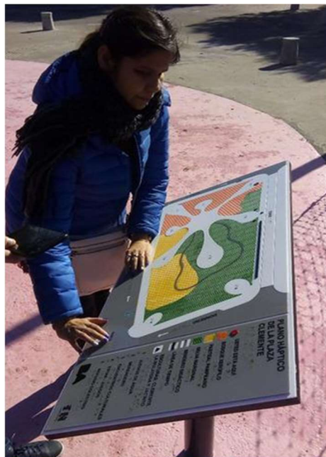
Imagen 12: Una mujer en situación de discapacidad visual utiliza el plano háptico para recibir la información sobre la plaza y sus áreas.