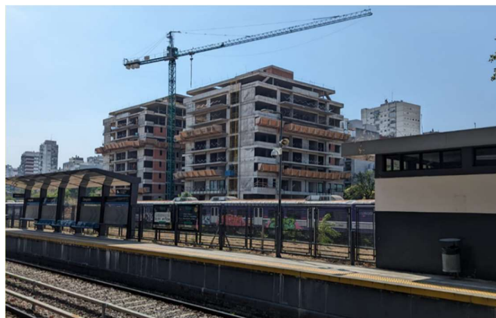
Imagen 14: Vista de los edificios en construcción y de una gran grúa, desde la estación de Colegiales.