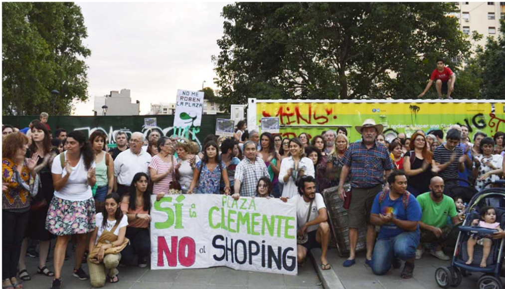
Imagen 7: Numeroso grupo de vecinos con un gran cartel que dice “Sí a la Plaza Clemente, NO al shopping” frente a un vallado en el predio en conflicto.

Iniciamos entonces un proceso de diseño participativo vecinal ( Imagen 8 ). En los dos meses de reuniones, surgió un programa de diseño basado en tres ejes: plantación de flora nativa, diseño de espacios y equipamientos inclusivos y respeto por la historia e identidad del barrio de Colegiales. Finalmente conseguimos ser convocados por el Ejecutivo de la Ciudad y nuestras ideas fueron confrontadas con la propuesta del GCBA. En una síntesis final, donde se impusieron los 3 ejes surgidos de la participación popular, el GCBA preparó los planos y llamó a licitación para la construcción de la plaza. El 2 de julio del 2019 se inauguró la Plaza Clemente.